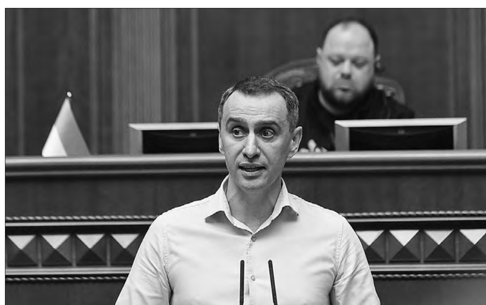
Міністр охорони здоров'я України Віктор Ляшко.