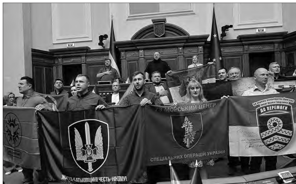
Під час засідання.

Йдеться про правові, економічні та організаційні засади переходу до моделі єдиної компанії шляхом приєднання АТ «Магістральні газопроводи України» до ТОВ «Опера-