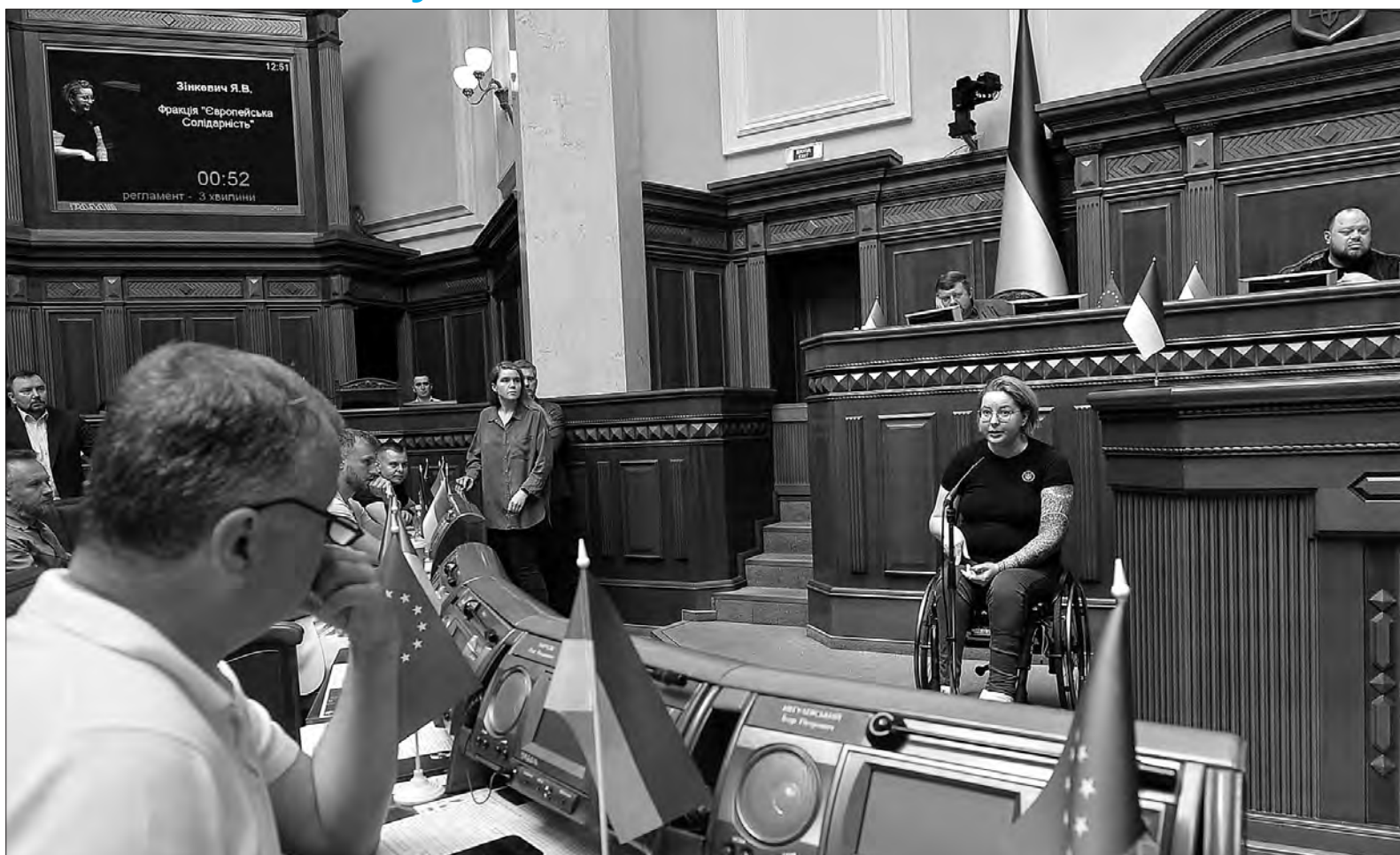
Більше фото тут — www.golos.com.ua